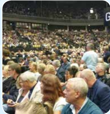
Der er altid fuldt hus til LNS foredrag!