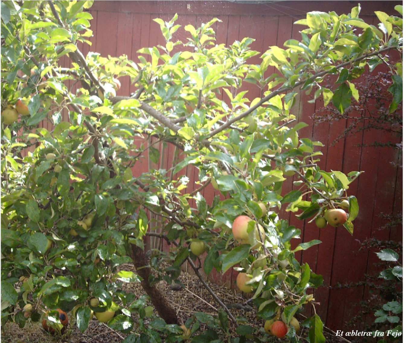
Et æbletræ fra Fejø